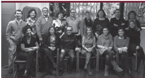
EL COMITÉ ORGANIZADOR LOCAL